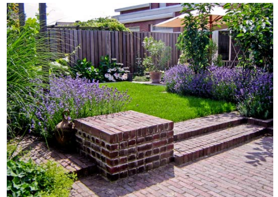
Het gemetselde blok is handig om even op te gaan zitten.