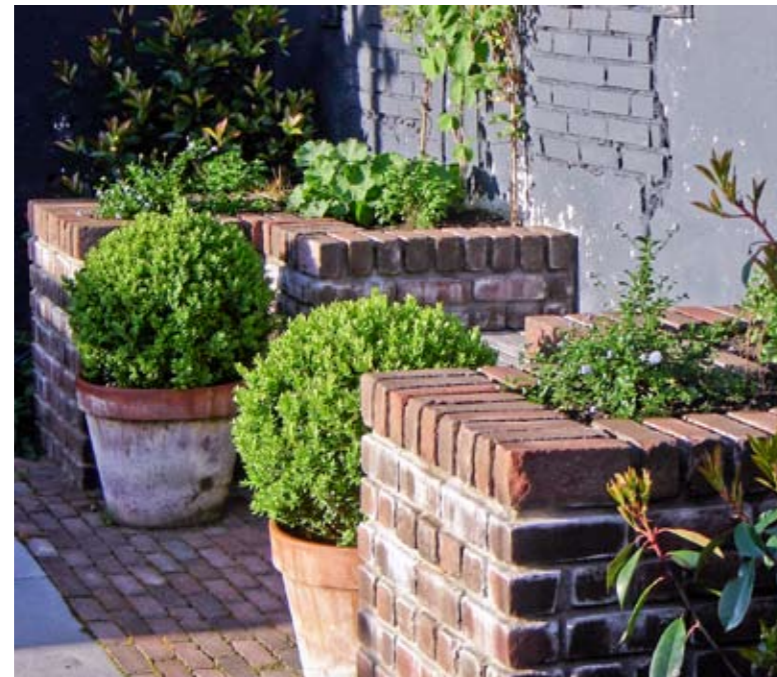
Tussen de gemetselde bakken achterin de tuin is een vaste hardhouten bank gemaakt.

De meeste mensen die een tuinontwerp laten maken willen vooral een onderhoudsarme tuin. Het gezin dat hier woont, vormt hierop volgens de tuinontwerpster een uitzondering. Voor hen is onderhoud geen probleem en dat is te zien, want de tuin wordt goed bijgehouden. Wat beplanting betreft hadden de opdrachtgevers duidelijke wensen: veel en natuurlijk ogend groen, en veel bloemen met hier en daar een pittig kleuraccent. Ook wilden ze rozen, lavendel, buxus, hortensia's en fruit, en een gazon. Al deze wensen zijn verwerkt in de tuin, net zoals de andere wensen: een groot terras bij de woning, een klein terras achterin de tuin, een romantisch prieeltje, speelgelegenheid voor de kinderen, hoogteverschillen en een tuinkast voor het gereedschap. De woning ligt in een nieuwbouwhofje te midden van oude woningen; de oude muur aan de achterkant van de tuin moest dan ook gehandhaafd blijven. Vóór de oplevering van de